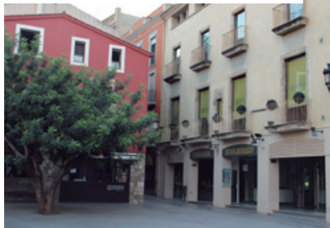
Palau dels Masferrer-Perpinyà, 2014.