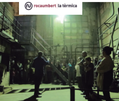
Visita nocturna a La Tèrmica. Fons Roca Umbert