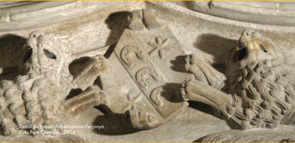
Detall de l'escut dels Masferrer-Perpinyà. 2014

Les Jornades Europees del Patrimoni, creades el 1991, varen néixer per acostar el ciutadà al patrimoni arquitectònic monumental. Aquest tresor col·lectiu és palès tant a la realitat més local, no menys certa ni de menys interès, com a la dimensió continental. Un any més, Catalunya, i concretament Granollers, es farà ressò d'aquesta onada que sacsejarà Europa en un cap de setmana ple de tota mena d'activitats gratuïtes amb una clara finalitat: descobrir aquest llegat excepcional que és el patrimoni arquitectònic i natural i gaudir-ne.